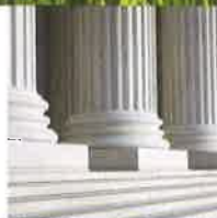
Tableau de bord / 07

/ Un congrès national 2015 « Spécial Anniversaire 60 ans » !